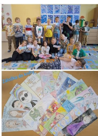
Záložka do knihy