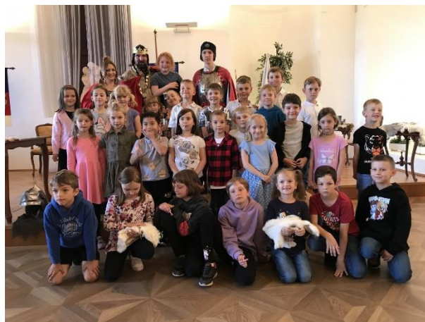
Pasování na čtenáře