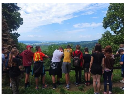
Exkurze na Lukov a Bezedník