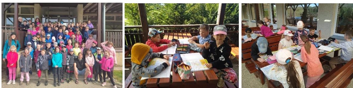
Škola v přírodě