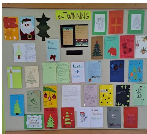
e – Twinning