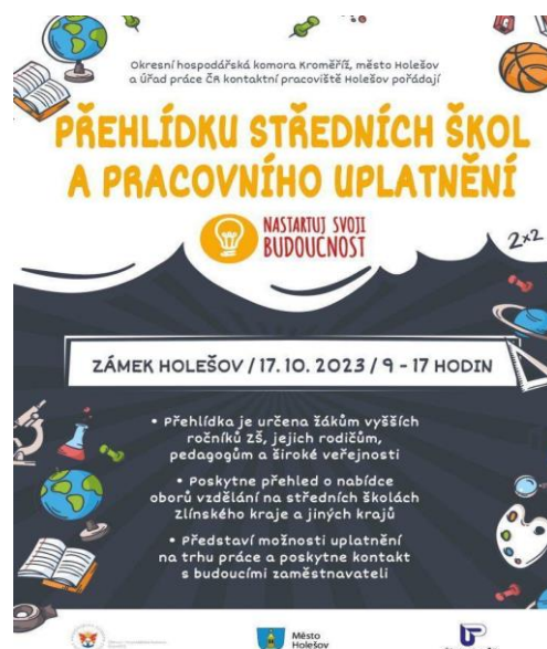
Úřad práce v Kroměříži