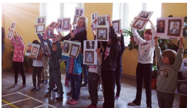
Projektový den Bedřich Smetana