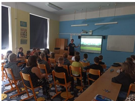
Beseda o USA