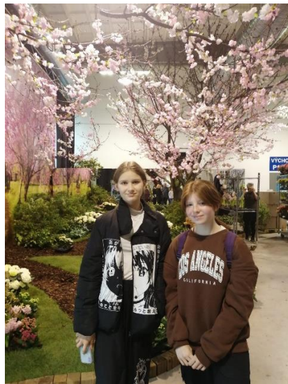
Soutěž Floria v Kroměříži