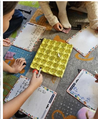
Kouzelnické hodiny matematiky