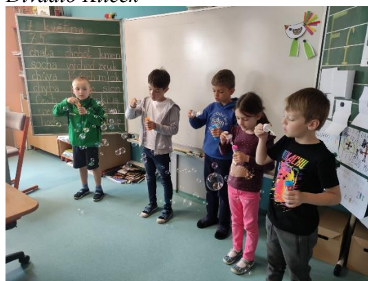
Logopedický kroužek - logohrátky