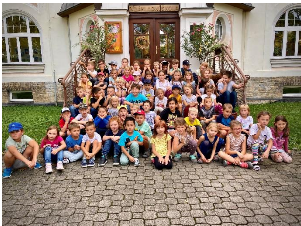
Cesta kolem světa