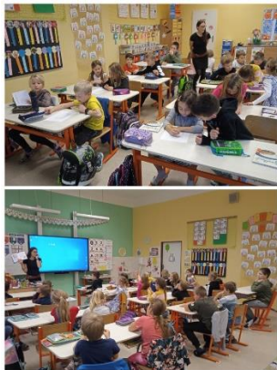
Autorské čtení 5. A