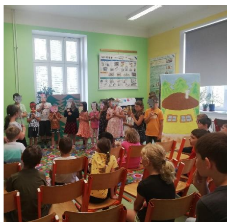
Boudo, budko – anglické divadélko