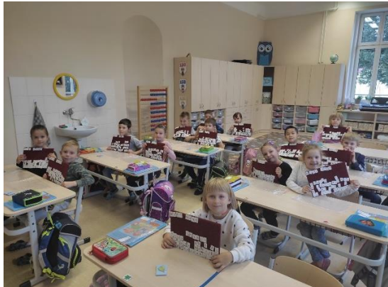
Co už umíme v 1. A