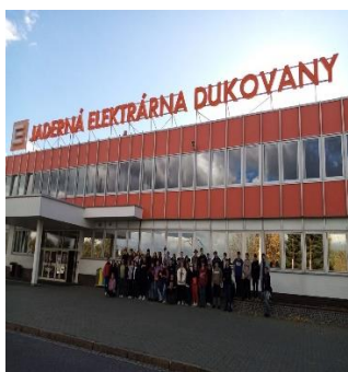
Exkurze - jaderná elektrárna Dukovany