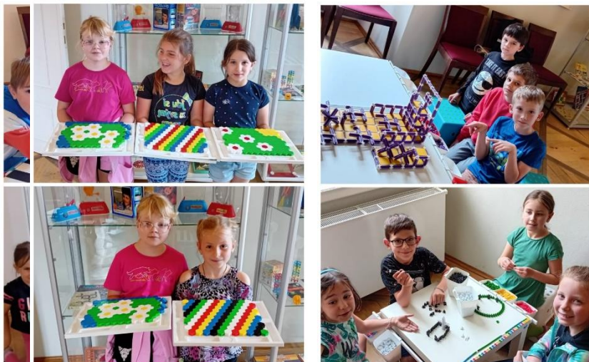
Výstava Seva – holešovský zámek