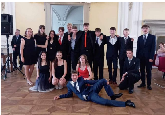
Rozloučení s žáky 9. A na holešovském zámku