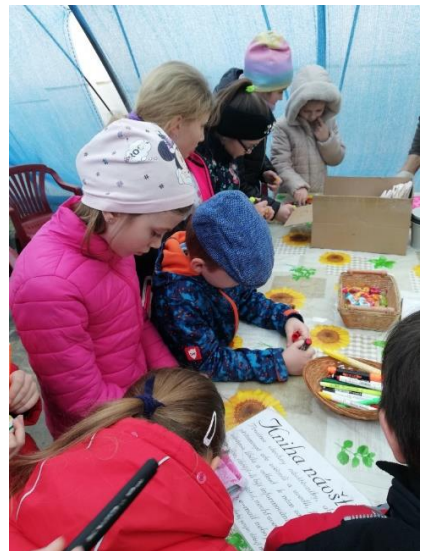
Jaro v zahradnictví