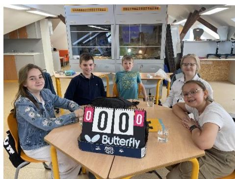
Máme rádi Česko